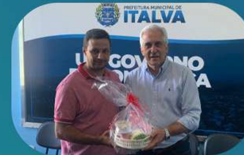
Prefeito Leo Pelanca Italva