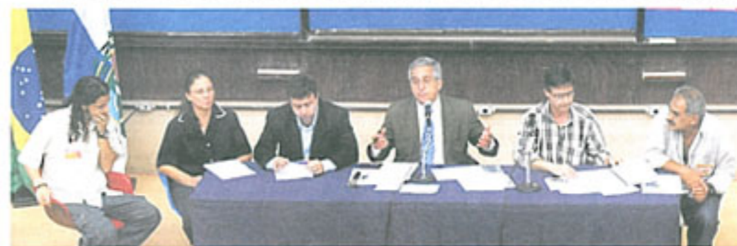
Comissão se reúne na UERJ para propor aumento de recursos no orçamento do estado de 2009.

A Comissão de Educação da Alerj, presidida por Comte há dois anos, debateu exaustivamente o desmonte das universidades públicas estaduais. Depois de várias audiências públicas, conseguiu-se garantir R$ 14,6 milhões adicionais no orçamento para a UERJ, a UEZO, a UENF e o Cecierj.