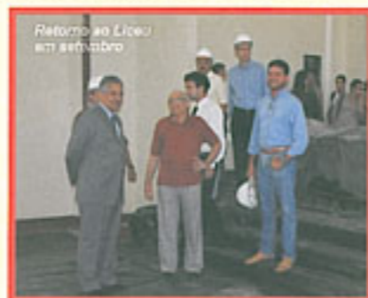
Retorno ao Liceu em setembro

obras, Comte recebeu a garantia de que o prédio estará pronto até janeiro de 2008.