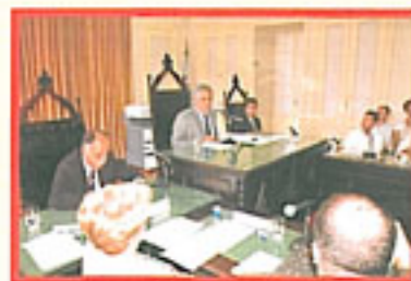
Audiência Pública da Comissão de Educação: CELEMO