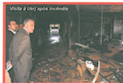
Visita à Uerj após incêndio