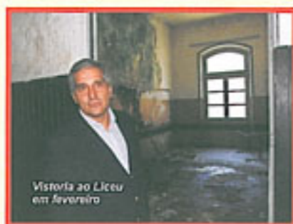
Vistoria ao Liceu em fevereiro

O tradicional Liceu Nilo Peçanha, em Niterói, onde ocorreu desabamento de parte do telhado, foi um dos primeiros estabelecimentos de ensino visitados por Comte assim que assumiu a presidência da Comissão. O deputado voltou mais duas vezes ao local. No início de setembro, foi com parlamentares da Comissão