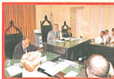
Audiência Pública da Comissão de Educação: CELEMO