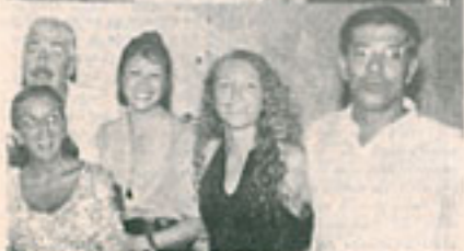
Equipe do Gabinete desejando a todos um Feliz Natal e um Próspero 94.

Horário de Atendimento no Gabinete Assessoria: 2a. a 6a. feira de 9 às 19 hs Vereador: 4as. feiras de 16:30 às 18 hs 6as. feiras de 11 às 12 hs Tels. 717-1723 direto e 717-4343 r-213