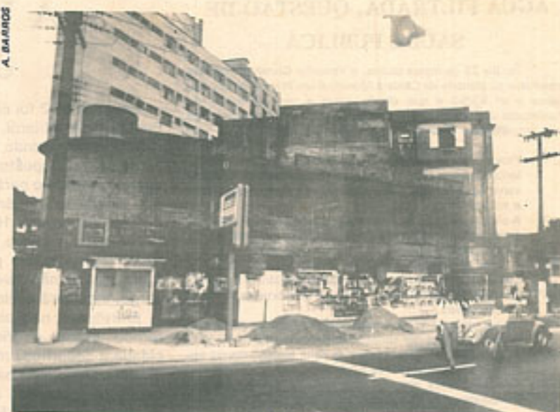
As obras paralisadas da Farmácia Universitária

Tal indicação representa uma contribuição decisiva do Poder Público para a saúde da comunidade e conseqüentemente para a busca de um melhor equilíbrio social.